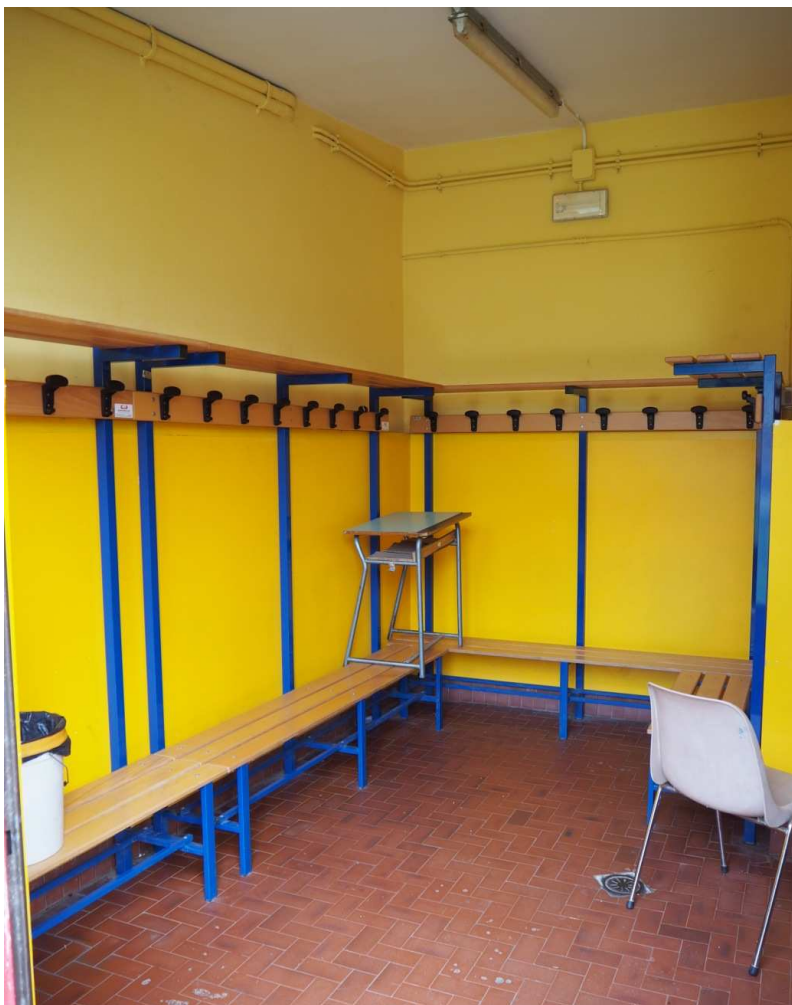
10) Veduta interna di uno dei locali spogliatoio esistenti; si notano le ridotte dimensioni