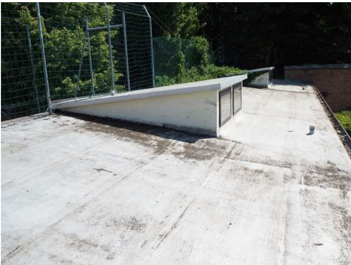
9) veduta della copertura dell'edificio che ospita gli spogliatoi, realizzato a ridosso del muro di confine nord, con l'area di servizio del collegio universitario Ederle di via Belzoni. Si notano gli abbaini che forniscono areazione e illuminazione ai locali di servizio più interni