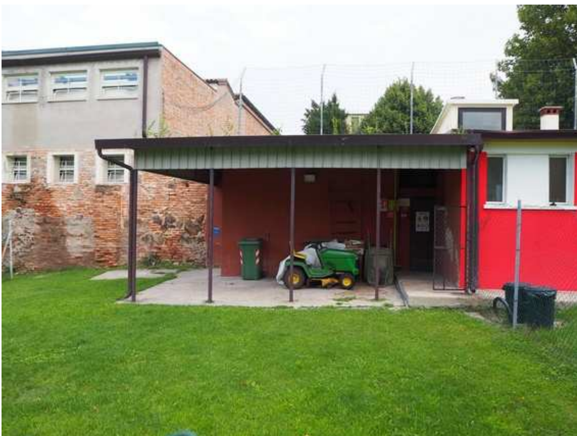
7) Particolare della tettoia esistente ad ovest, verso il campo calcio.