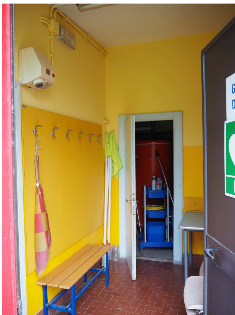
13) Veduta dello spogliatoio arbitri situato ad ovest dell'edificio, a confine con la tettoia esterna