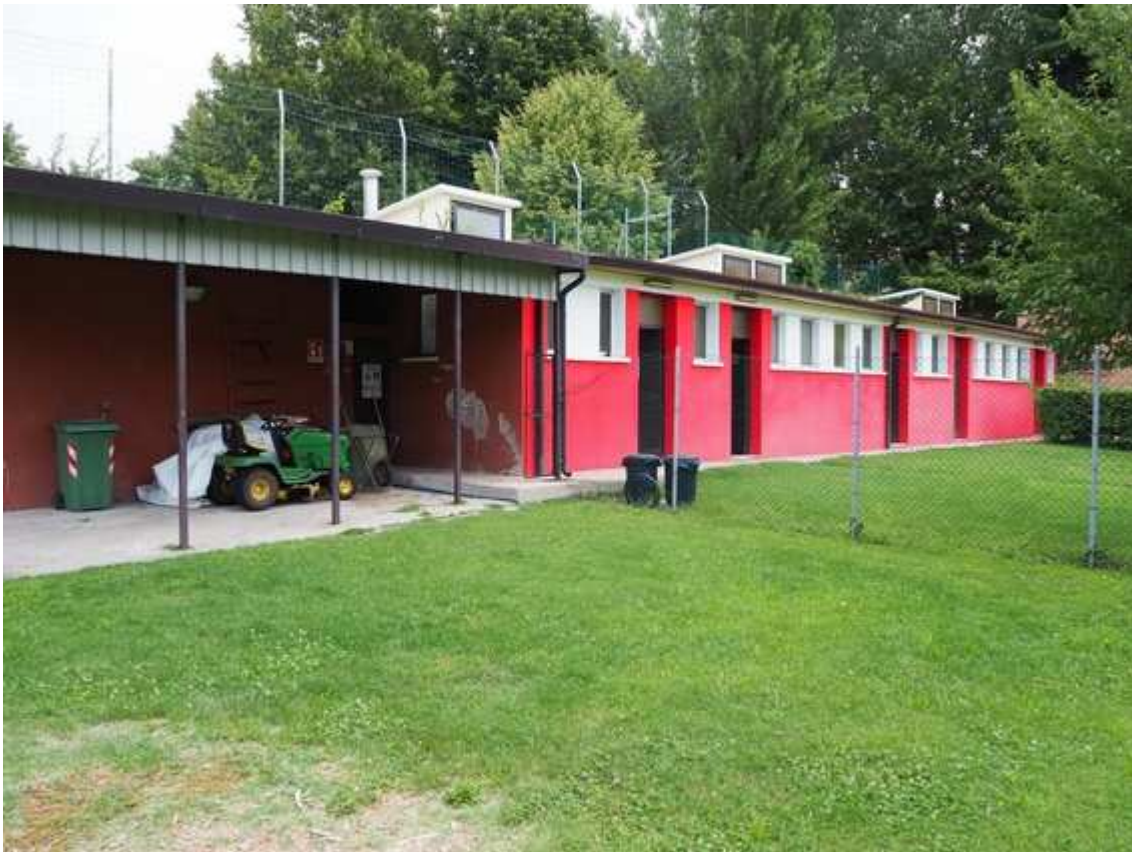
6) Veduta completa del prospetto sud del corpo spogliati calcio