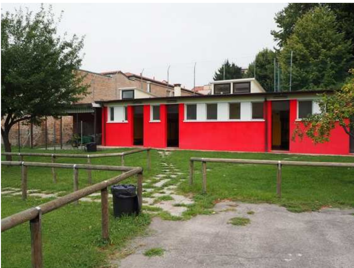
5) L'altro tratto del prospetto sud del corpo spogliatoi calcio, con gli accessi ai vari spogliatoi