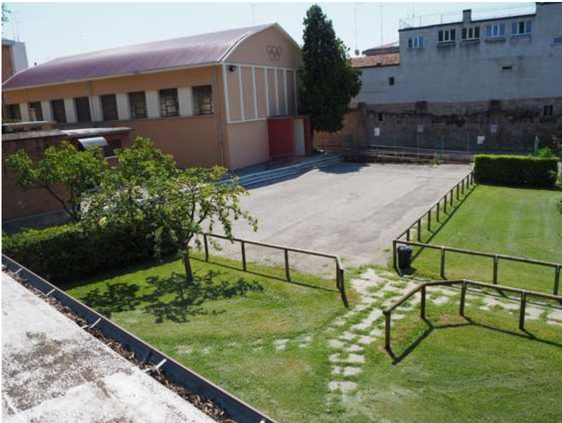
8) Veduta dell'area fra la palestra ed il campo calcio, dove verrà realizzato il nuovo corpo spogliatoi, vista dalla copertura degli spogliatoi esistenti