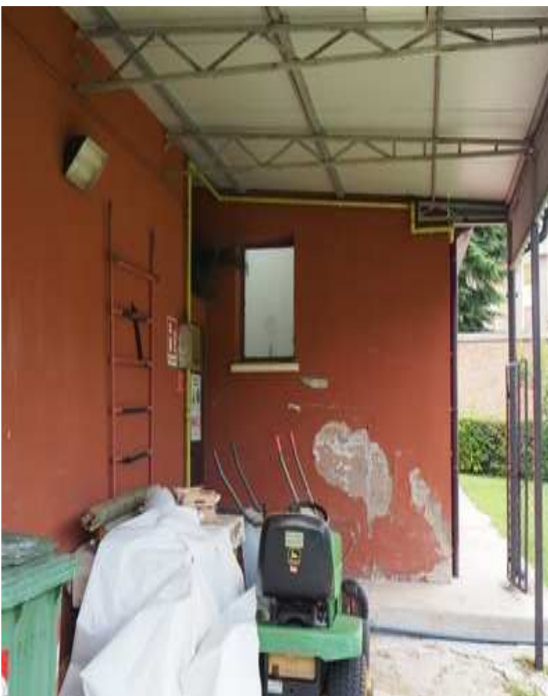
15) Particolare della tettoia esterna, realizzata in adiacenza ad ovest al corpo spogliatoi e successivamente parzialmente chiusa per realizzare il locale a nord