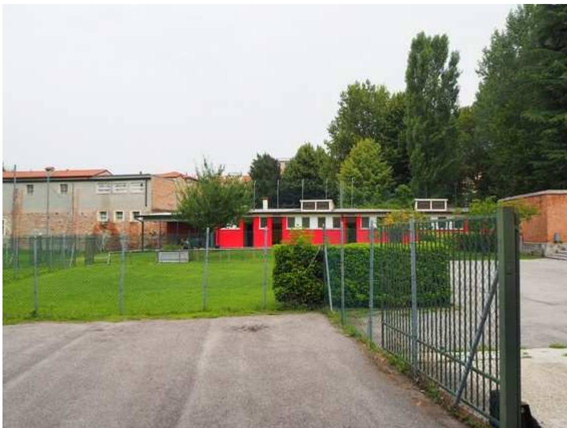
3) Veduta degli spogliatoi esistenti per il calcio, da sud, nell'angolo nord est dell'area, addossati alla mura di confine