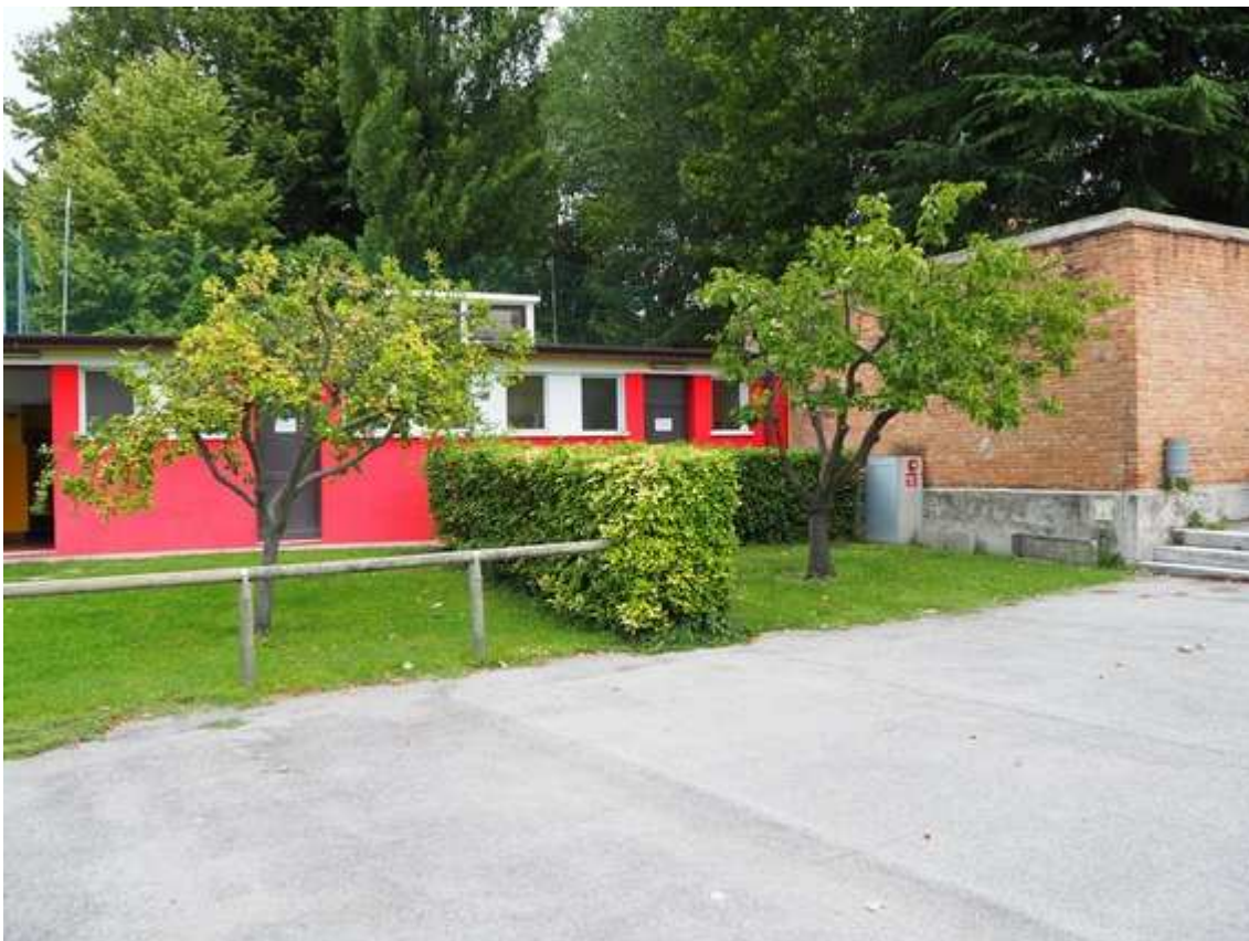
4) Particolare del prospetto sud degli spogliatoi calcio esistenti, nell'angolo nord est