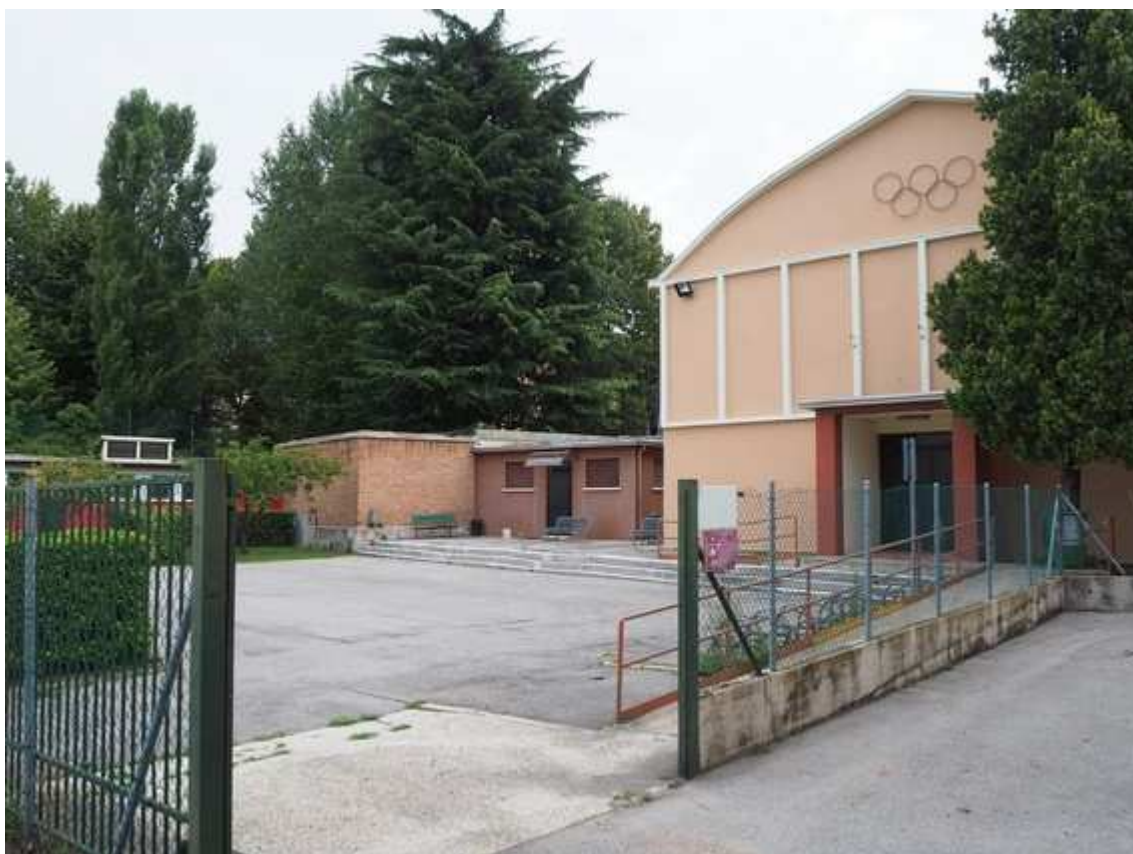
2) Veduta della palestra Petron, con gli adiacenti spogliati, realizzata negli anni '50, da sud ovest, dal parcheggio dell'impianto