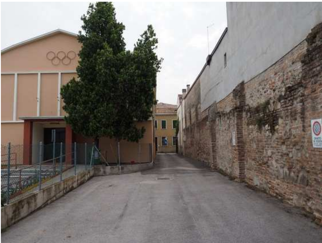
1) Veduta dell'ingresso all'impianto sportivo Petron da vicolo San Massimo, con la palestra

Comune di Padova Settore Lavori Pubblici