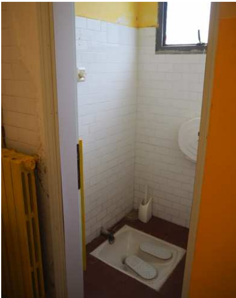
14) Particolare di un dei servizi igienici esistenti a servizio degli spogliatoi